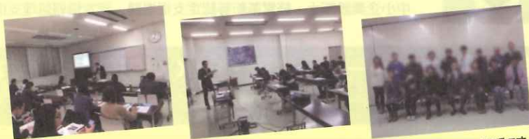
次あなたが夢を実現する番です

昭和村商工会創業塾では、自分のやりたいことで「創業」の実現を目指すだけではありません。そして、意欲的な創業仲間を増やすことができることも含めて、 一生の財産を手に入れることができる のです。