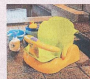
大浴場にはお子さま用のイスやおもちゃが用意されています。