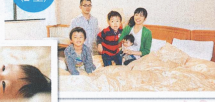
2つのベッドを敷けた洋室では、家族みんなで川の字で寝られます。