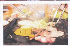
春から秋は、外のテラスで赤城牛と奥利根もち豚のBBQはいかが?

所在地: 昭和村森下 2406-2 TEL: 0278-25-4831 (道の駅) 0278-50-3003 (旬菜館) 営業時間: 9:00 ~ 18:00 (4月~10月), 9:00 ~ 17:00 (11月~3月) 定休: 1月1日、1月第3火曜日 駐車場: 64台 HP: agream-showa.jp/ ※おむつ替えができる多目的トイレあり