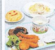
キッズメニューも用意。フライ、ハンバーグ、オムライスなどお子さまの好きなメニューがそろいます。