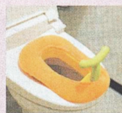
部屋のトイレには補助便座のほか、おむつのゴミ入れや踏み台なども。