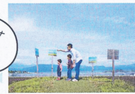
道の駅の裏手には、谷川連峰を一望する展望台が!

ママVOICE 野菜がとってもリーズナブル! ママ友にもおすそ分けしておきたいな