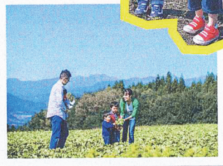
美しい山あい広がるレタス畑。雄大な風景の中で、家族の会話も弾みます。