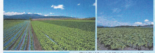
一面に広がるレタス畑やこんなにやく畑...