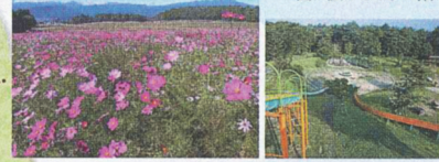
5000㎡の広さを持つコスモス畑は壮観!(10月が見ごろです。)