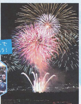
「ウィンターフェスティバル」では冬花火の打ち上げも。空気が澄んでいるのでとってもキレイ。