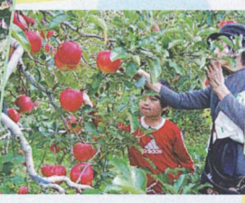
準高冷地の自然環境なので甘くて美味しいりんごがたくさんとれます。