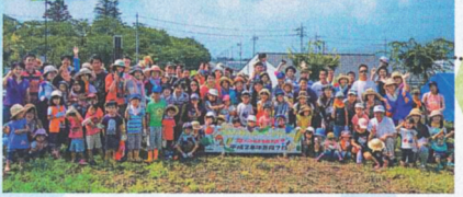
「ミキハウス ハッピー・ノートファーム」では2坪の畑のファームオーナーに! 毎年100名以上のファミリーが全国から参加しています。(2017年度も開催予定)