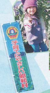
収穫した自慢の大きな大根を持ってハイチーズ!