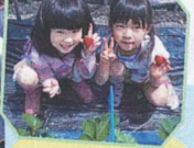
お子さまでも簡単にできるイチゴ狩りはファミリーに大人気! GW頃まで楽しめます。