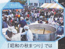
「昭和の秋まつり」では大迫力のこんにやく大なべ(6,000人分)も登場!