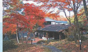
森の中に佇む心休まる「昭和の森山荘」。近くには昭和の森ゴルフ場も。